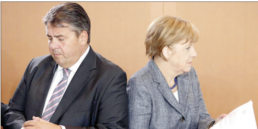
آنگلا مرکل و زیگمار گابریل

معاون صدراعظم آلمان و رهبر حزب «سوسیال دموکرات‌ها» قصد دارد به‌زودی برای رقابت با آنگلا مرکل، صدراعظم آلمان کاندیدای انتخابات شود. زیگمار گابریل، رهبر حزب «سوسیال دموکرات‌ها» قرار است که در حال حاضر وزیر اقتصاد و معاون صدراعظم آلمان است می‌خواهد از کاهش محبوبیت مرکل استفاده کند و در انتخابات امسال با صدراعظم آلمان به رقابت بپردازد. به نوشته رسانه‌های آلمان، زیگمار گابریل در مذاکراتی محرمانه با رهبران حزبی به‌عنوان کاندیدای حزب سوسیال دموکرات انتخاب شد و قرار است در روزهای آینده این تصمیم حزبی علنی قرار است در روزهای آینده این تصمیم حزبی علنی این سمت نامزد شود.