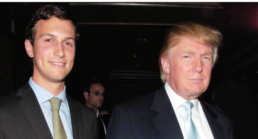
دونالد ترامپ و دامادش جارد کوشنر

هم‌نسبت به تصمیم دونالد ترامپ برای انتصاب کوشنر ابراز نگرانی کرده‌اند. اعضای ارشد کمیته امور حقوقی مجلس نمایندگان کنگره با ارسال نامه‌ای به وزارت دادگستری و اداره حفظ ضوابط اخلاقی دولت فدرال خواستار رسیدگی به تصمیم ترامپ در چارچوب قوانین ضدخویشاوندسالاری شده‌اند. این نامه بنا به درخواست گروهی از نمایندگان کنگره از حزب دموکرات تهیه و ارسال شده است.