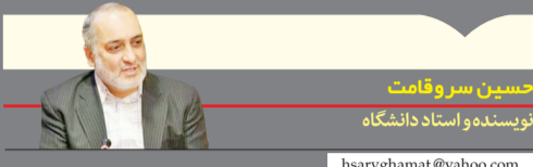
حسین سروقامت نویسنده و استاد دانشگاه