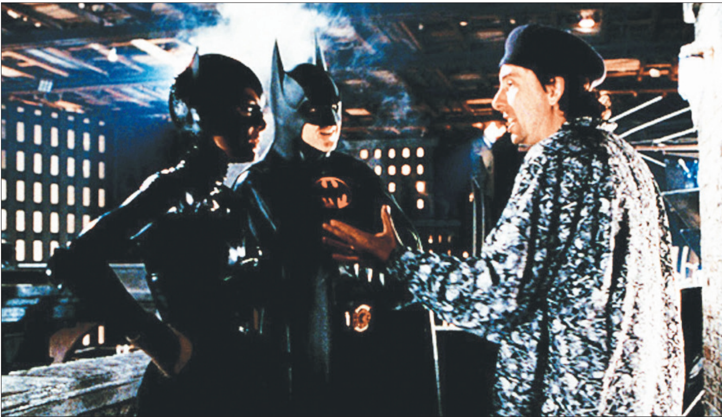
تیم برتون در نمایشی از فیلم «بازگشت بتمن»