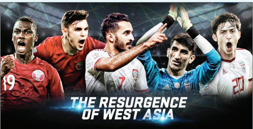
THE RESURGENCE OF WEST ASIA

مساله صرفاً نتیجه‌گیری نیست، مساله این نیست که دیگر چیزهایی مثل برنامه‌ریزی در فوتبال یا سرمایه‌گذاری درست مختص شرقی‌ها نیست و این جدای از هر نتیجه‌ای احتمالا یکی از مهم‌ترین دستاوردهای تحلیلی جام‌ملتی آسیا خواهد بود. فوتبال در آسیا دارد به سمت توازن جدیدی حرکت می‌کند، با قدرت‌های بیشتر و توزیع‌تیمی‌هایی رقابتی‌تر.