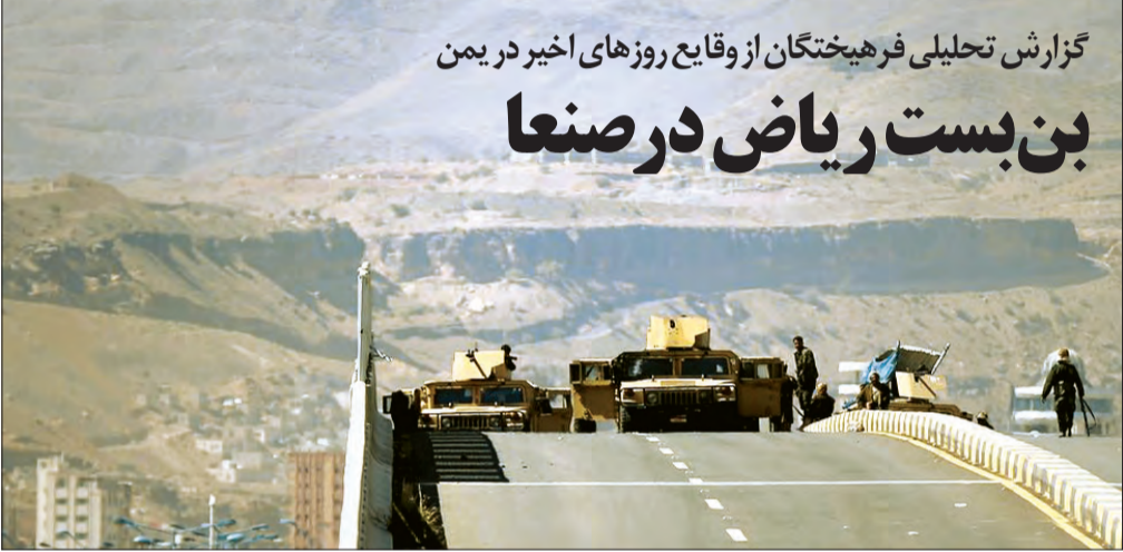
لیل شش‌شنبه ۲۲ژانویه۲۰۱۵مجموعی م عتقل سواران یمن در بن‌بست صهیونیستی(روایت)